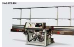
Canteadoras rectilíneas verticales para los cantos planos