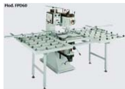
Taladros a brocas opuestas