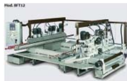
Canteadoras bilaterales para los cantos redondos