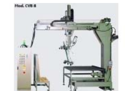
Cargadores para vidrios