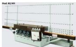
Canteadoras rectilíneas verticales para los cantos redondos