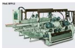
Canteadora bilaterales para los cantos planos